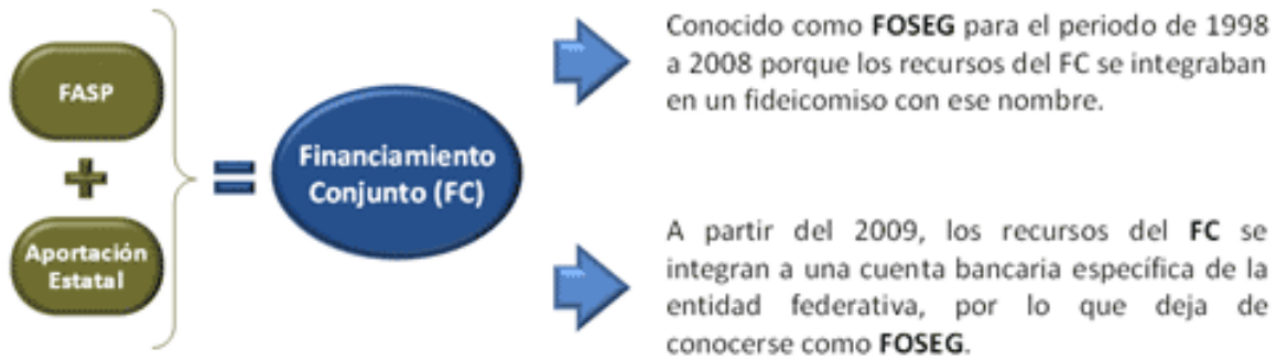
Figura 1. Mezcla de recursos para el financiamiento conjunto entre la federación y las entidades federativas.