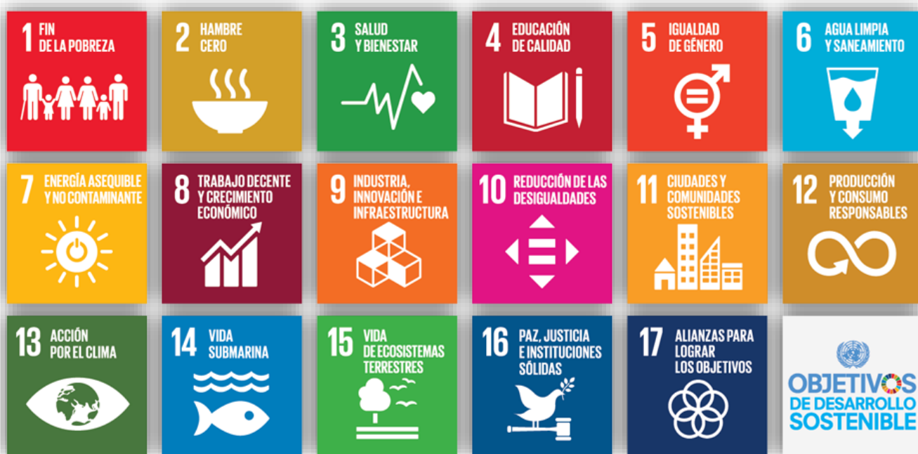
Gráfico. 1.2.1 Objetivos de Desarrollo Sostenible

Se recomienda actualizar el enfoque del presente cuestionamiento con referencia a la evolución de los Objetivos de Desarrollo del Milenio a los Objetivos de Desarrollo Sostenible.